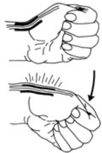
Een beweging die normaal pijnlijk is bij de Quervain peesschede ontsteking.