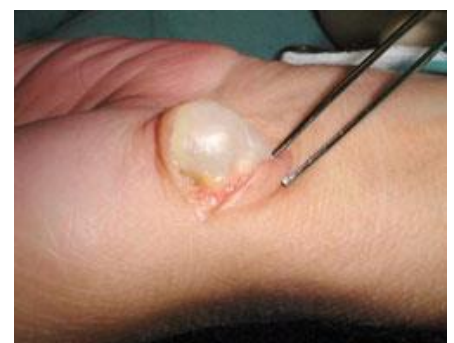
Het typische glazige aspect van de cyste komt doordat de inhoud bestaat uit gewrichtsvloeistof.