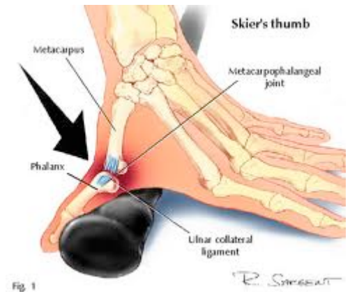
Door een inwerkende kracht overstrect de duim. Hierdoor scheurt het bandje dat normaal tegen deze krachten hoort te beschermen.

Indien u bloedverduunners gebruikt moet u hier 5-10 dagen op voorhand mee staken. Dit kunt u best in overleg met uw huisarts doen. Asaflow mag u echter gewoon doorgebruiken.