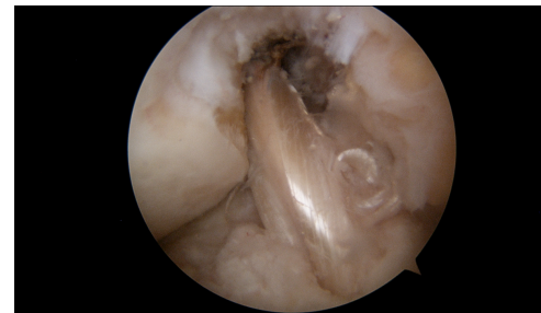
Arthroscopisch beeld van een reconstructie van de voorste kruisband met hamstrings autogrefte